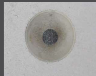
Ancre de levage